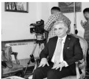
Хусрав Нозирӣ Муовини якуми Вазири корҳои хориҷии Ҷумҳурии Тоҷикистон.

Феврали 2007 нахустин сафари расмӣ Президенти Ҷумҳурии Тоҷикистон Эмомалӣ Раҳмон ба Ҷумҳурии Арабии Миср баргузор гардид, ки дар он бастаи санадҳои ҳамкорӣ байни ду кишвар дар арсаҳои гуногун ба имзо расид. Яке аз натиҷаҳои муҳимми он боздиди таърихӣ ифтихои Сафорати Ҷумҳурии Тоҷикистон дар Қоҳира октябри 2007 буд, ки он нахустин намоёндагии дипломатии кишвари мо дар ҷаҳони араб гардид.